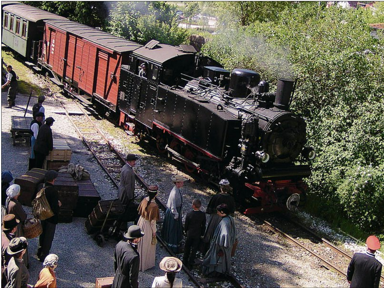
In der Nähe von Memmingen pflegt man seit vielen Jahren die Tradition der Dampflok-Reise – mitunter auch in historischen Kostümen.

Sogar im Winter dampft an wenigen Tagen rund um Weihnachten das Öchsle. Ansonsten gönnt sich zu dieser Jahreszeit die Lok